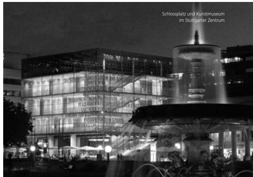
Schlossplatz und Kunstmuseum im Stuttgarter Zentrum