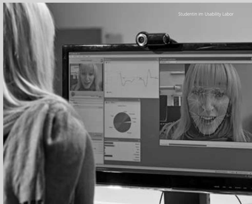
Studentin im Usability Labor

Für Fragen zur Zulassung und Bewerbung ist das Studienbüro (siehe Seite 8) zuständig. Mehr zur Bewerbung für den MBA International Business auf Seite 36.