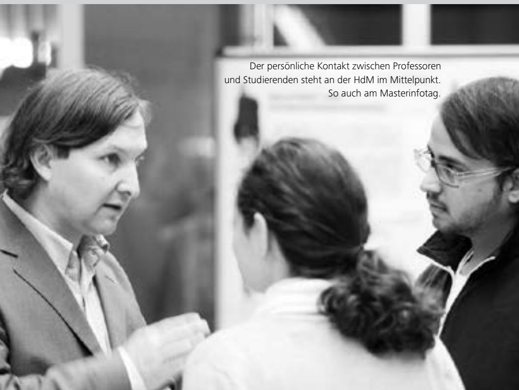
Der persönliche Kontakt zwischen Professoren und Studierenden steht an der HdM im Mittelpunkt. So auch am Masterinfotag.