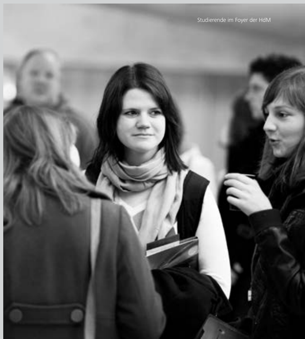
Studierende im Foyer der HdM

Die Fakultäten erteilen Auskünfte zu den Inhalten der Studiengänge. Für Fragen zur Zulassung und Bewerbung ist das Studienbüro (siehe Seite 8) zuständig.