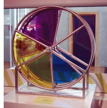
Abb. 3: Farbräder 10

Zudem ist es auch hier sinnvoll, neben den dauerhaften Ausstellungsobjekten entsprechende Bibliotheksmedien frontal zu präsentieren. Die Kinder werden durch die erfahrbaren Exponate aufgefordert, Phänomene zu hinterfragen und Hintergründe kennen zu lernen. Hierfür sollten ausreichend geeignete Kindersachmedien zur Verfügung stehen, die von den Kindern als Informationsquelle entdeckt und genutzt werden können. Die Medien der Bibliothek sollen ja weiterhin im Vordergrund stehen.