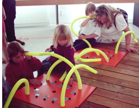
Abb. 2: Hörstationen 9