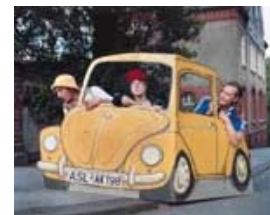
Abb. 3: Auszüge aus den Aufführungen des Vollplaybacktheaters 112