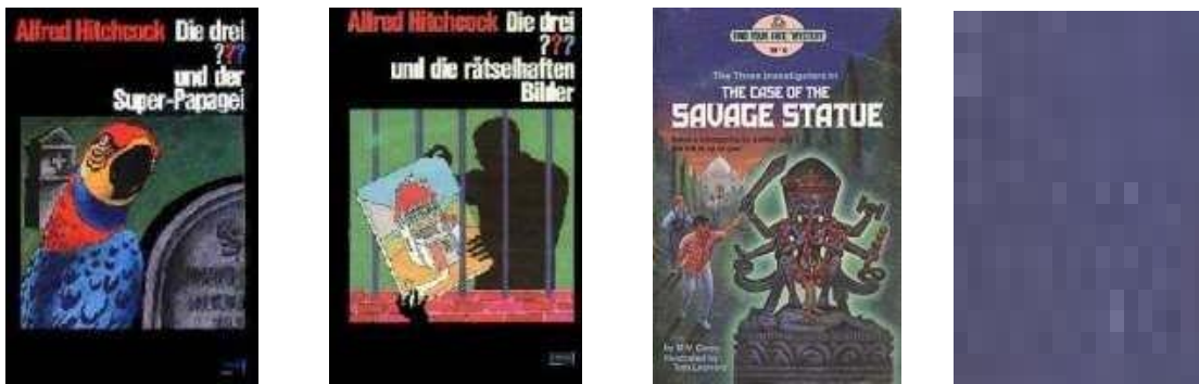
Abb.1: Beispiele für die Covergestaltung 48

Eine nicht vorhandene Folgenzählung der Bücher ist von Kosmos ebenfalls beabsichtigt, denn so soll den Lesern ein willkürlicher Einstieg in die Reihe ermöglicht werden. Daher gibt es in jedem Band entweder im Vorwort oder in der Handlung Erläuterungen zum Rahmen, zu den Protagonisten, deren herausragenden Eigenschaften und der Aufgabenverteilung innerhalb des Teams. Ebenso sollen Rückbezüge zu „alten Bekannten“ (meistens Gegenspieler der drei ???, die in früheren Bänden auftauchen) möglich sein.