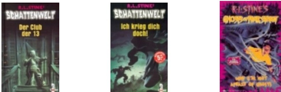
Abb. 4: zwei deutsche, eine US-amerikanische Ausgabe

Schattenwelt erscheint wie Fear Street im Loewe Verlag und so wundert es nicht, dass beide Reihen eine sehr ähnliche Gestaltung aufweisen.