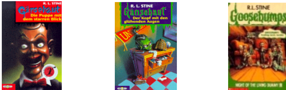
Abb. 3: v.l.n.r.: das alte und das neue Design der deutschen Ausgabe, die US-amerikanische Ausgabe

Viele Kritiker und Literaturvermittler verdammen die Gänsehaut-Bücher sicher schon wegen ihres Erscheinungsbildes: sie sehen aus wie Groschenromane. „Bei einer solchen Aufmachung darf man vermuten, dass die Bücher von Erwachsenen eher nicht gekauft werden“ 33 , urteilt das Bulletin Jugend & Literatur, doch für Kinder ist gerade das effekthascherische und „coole“ Cover 34 ein Anreiz.