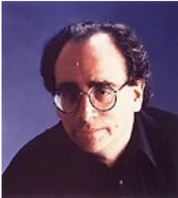
Abb. 1: R. L. Stine