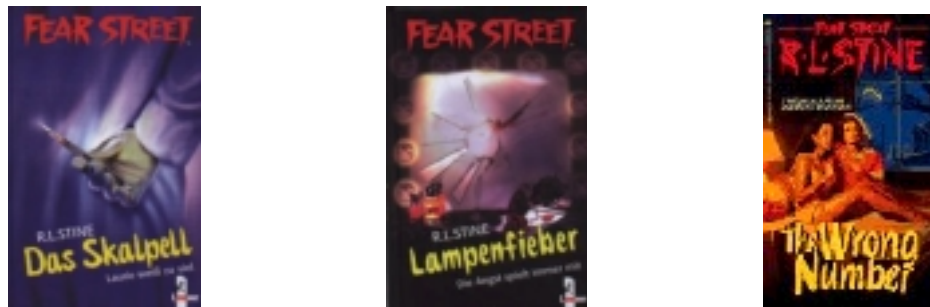
Abb. 2: zwei deutsche, eine US-amerikanische Ausgabe

Das Cover der Fear Street Bücher gibt in seiner Gestaltung bereits einen Vorgeschmack auf deren Inhalt.