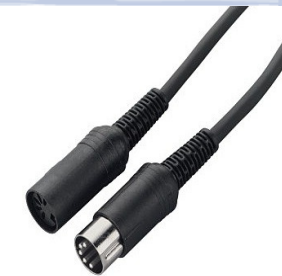
Schalter und Pedale