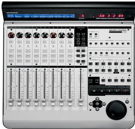
Mackie Controller als Fernbedienung