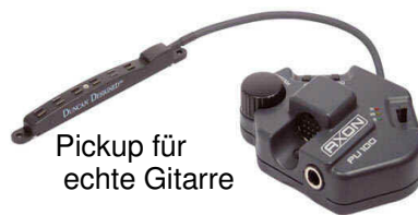
Pickup für echte Gitarre