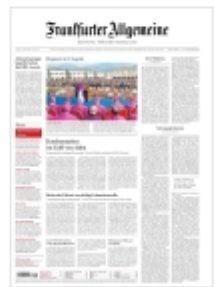
Frankfurter Allgemeine Zeitung