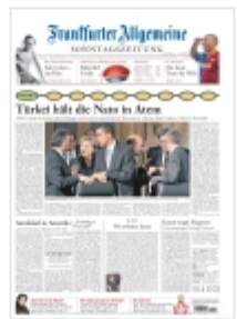
Frankfurter Allgemeine Sonntagszeitung