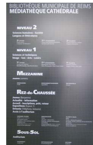
Die Bibliothek in der Jackentasche? Stuttgart, HdM, 23.04.2009