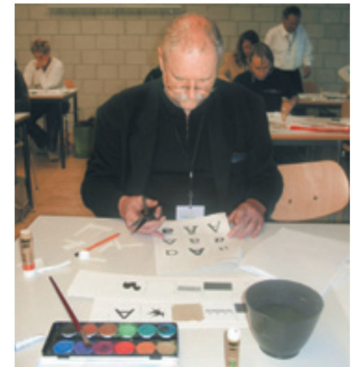
Schmecken, fühlen, hören und sehen – Synästhesie-Tester bei „Rotzgrün“.