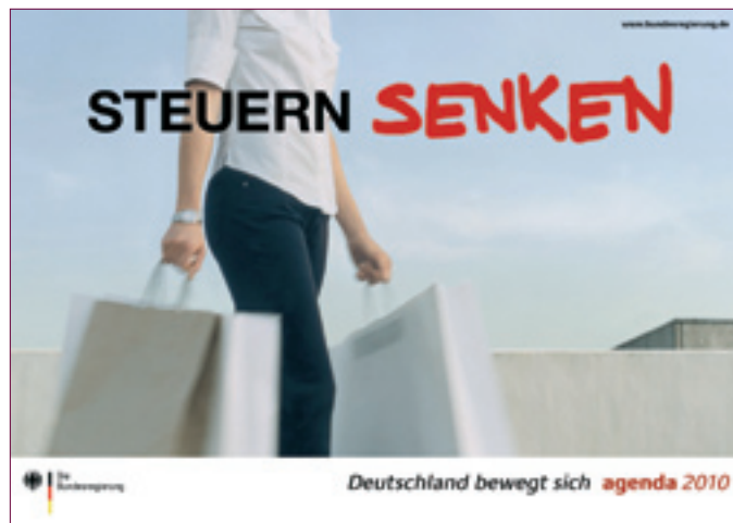
Aktuelles Motiv aus der Kampagne der Bundesregierung zur agenda 2010