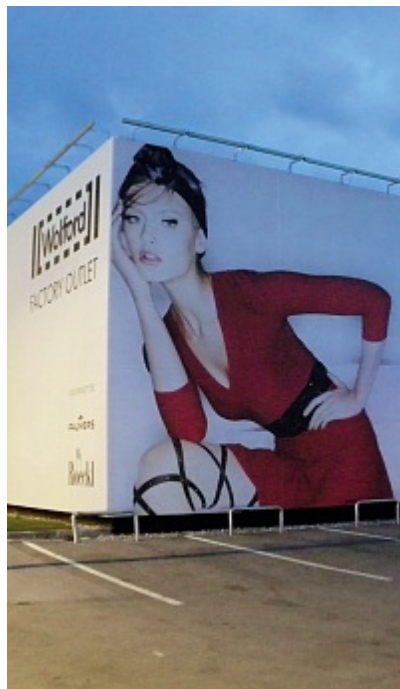
LFP: Die Außenfassadengestaltung am Wolford Outletcenter in Bregenz durch Megaprint.

„Magazin – Icon Touchcode“: Axel Springer, Berlin, Porsche Mailing Augmented Reality“: Chromedia Dialogmarketing, München „Evonik-Magazin – Das offizielle Sonderheft zur Meisterschaft“, „Magazin / NEXT – So leben wir morgen“ und „BMW Magazin“: Hoffmann und Campe Verlag, Hamburg, „QR-Schneeflocke, Weihnachtsmailing“: JWT Germany, Hamburg, „Musterboxen