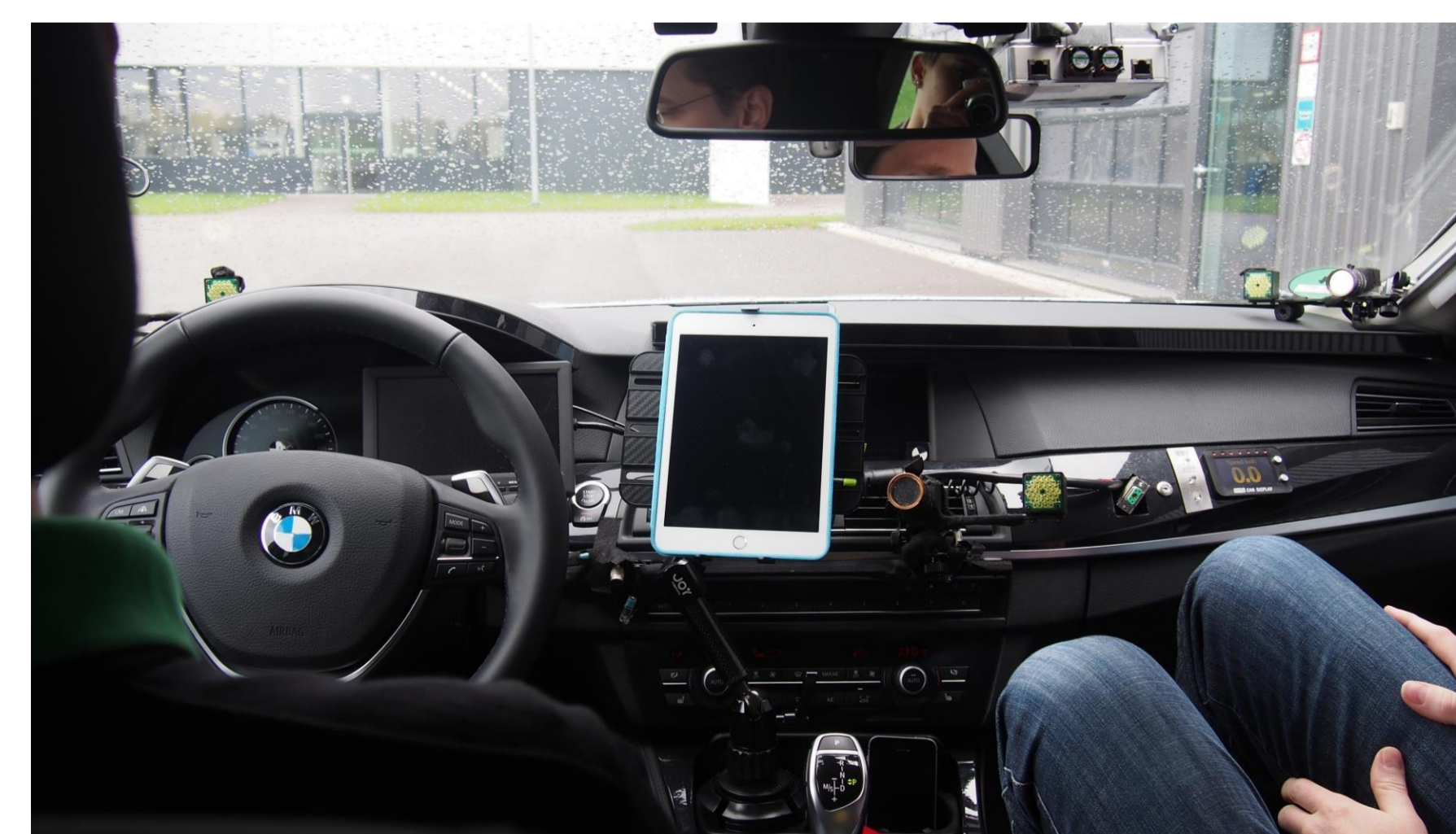
Hätten Sie's gewusst? Wizard-of-Oz-Fahrsituationen haben (forschungs-)ethische Implikationen, Stichwort: Turing-Deception