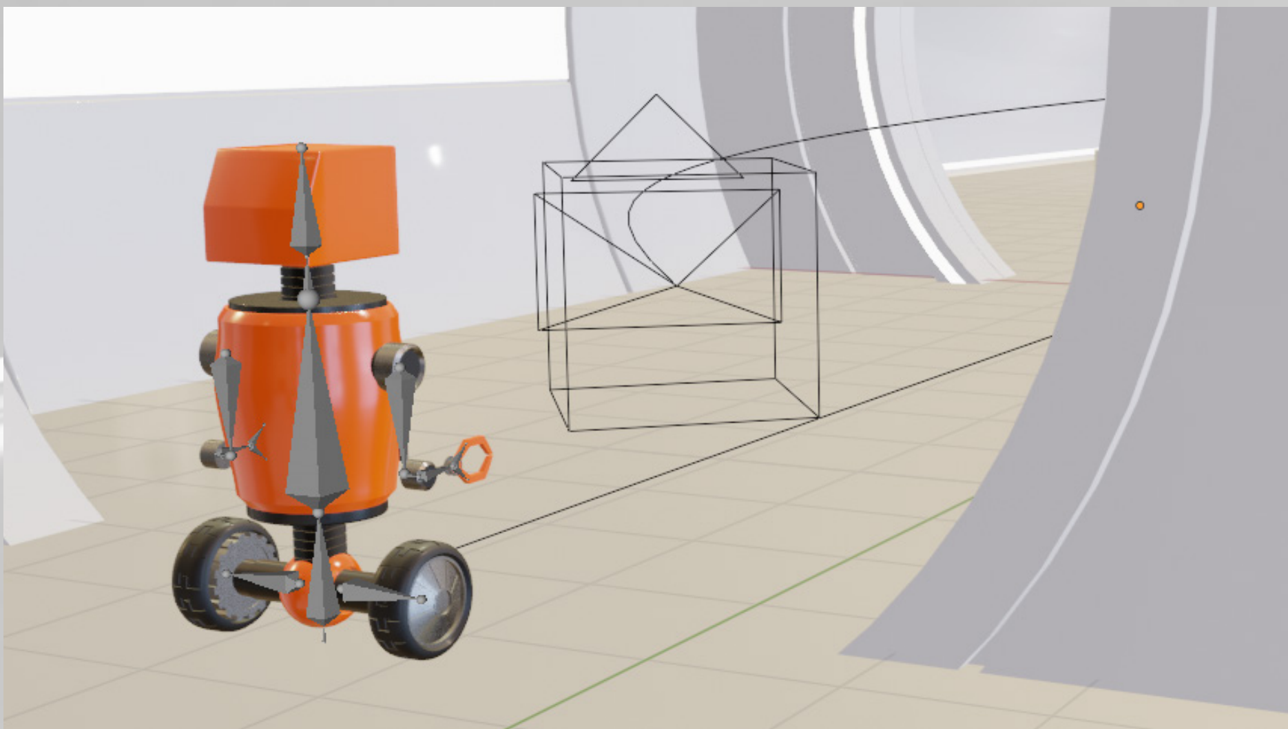
* Animationsprozess + Kameraführung