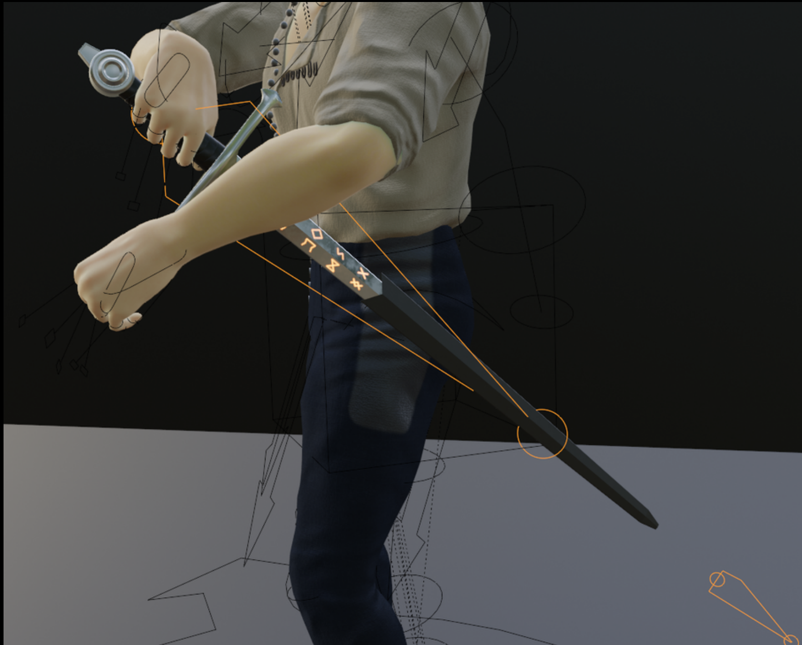
Rigging & Animation des Schwertes mit Hilfe der Bone Constraint "Child of".