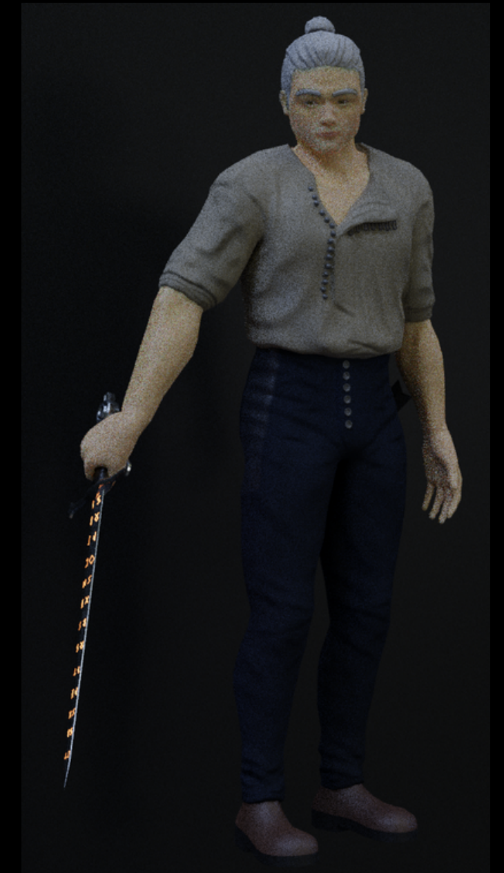
High Poly (Baked)